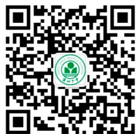
深圳中学官方微信 (szzxgfwx)